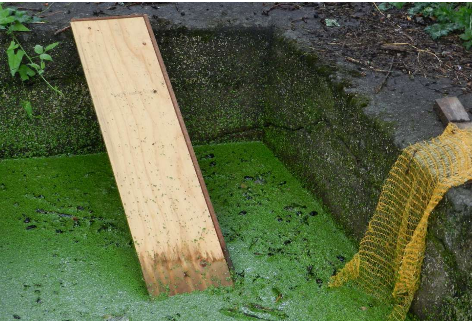
Planche et filet facilitant la sortie de la faune