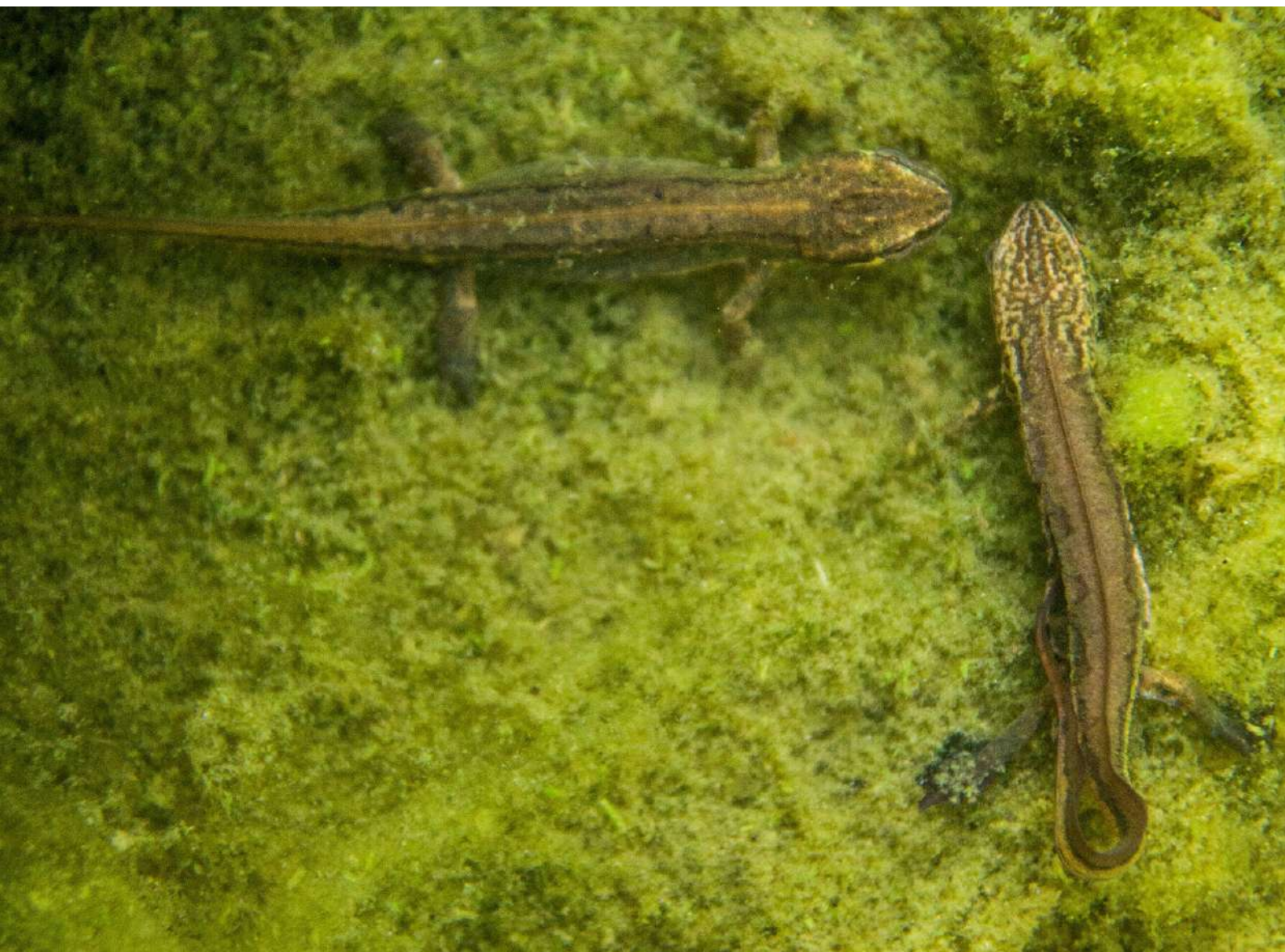
Tritons palmés dans les algues filamenteuses

Si des actions de prélèvement doivent néanmoins être menées sur les algues filamenteuses et les lentilles d'eau, celles-ci doivent être inspectées méthodiquement par un tri minutieux. En effet, déposer ces végétaux sur la berge du lavoir dans l'espoir que les animaux s'en échappent et regagnent le lavoir est illusoire. Hors de l'eau, ces tas constituent des pièges dont aucune larve ne peut s'extraire.