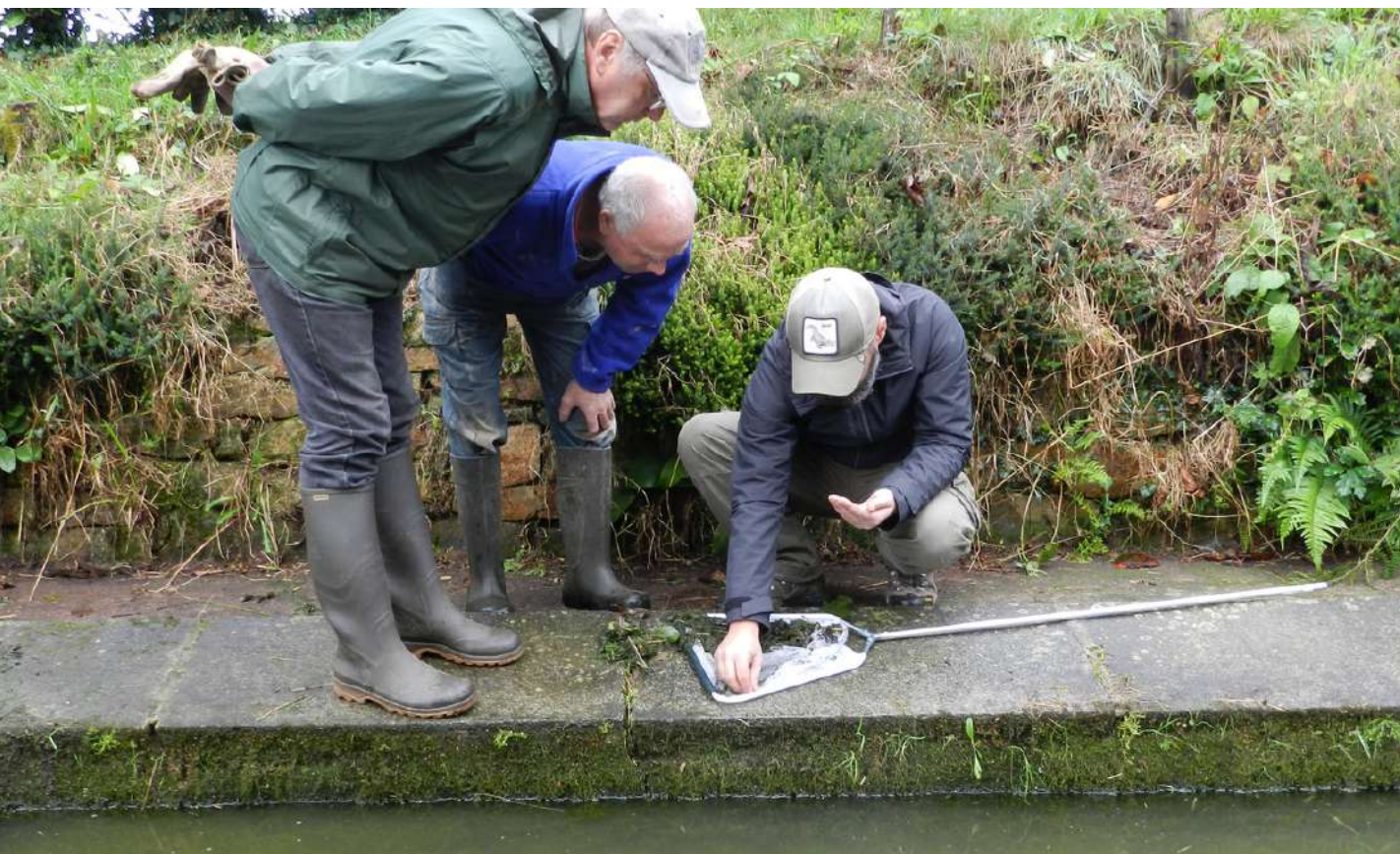
Pêche au filet avant vidange