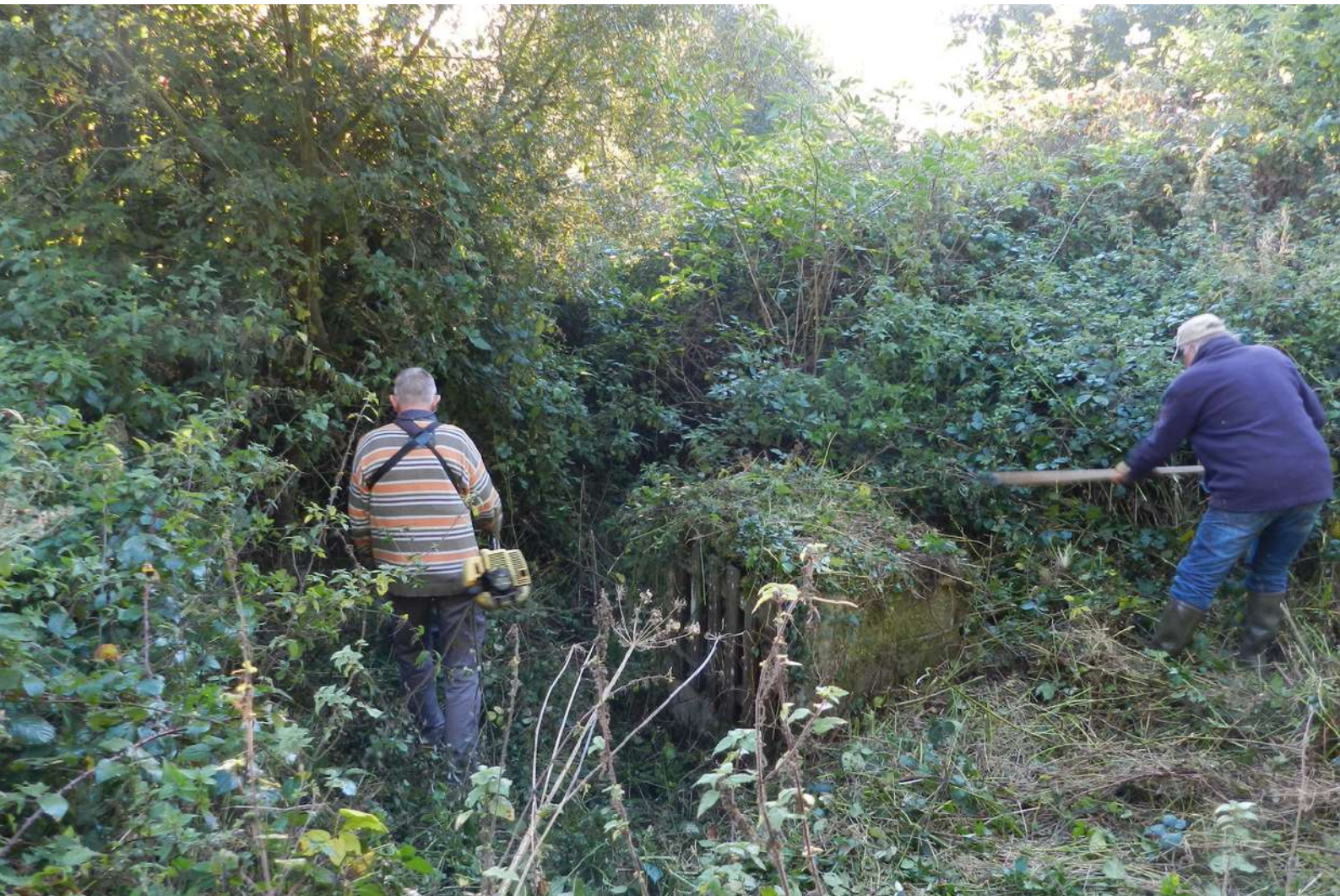
Débroussaillage avant travaux © Lavoires et fontaines à Plaintel

Afin d'en minimiser l'impact sur la faune, on effectue ces travaux à l'automne, en dehors des périodes pluvieuses, par temps sec et lorsque la végétation est sèche, en suivant les préconisations développées au point 10.