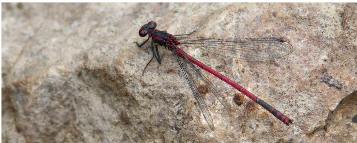
Petite nymphe au corps de feu © Claire Razložnik