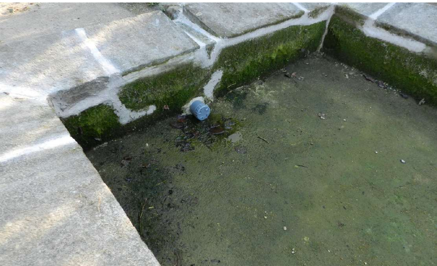
Pose d'une bonde de vidange munie d'une tête vissée