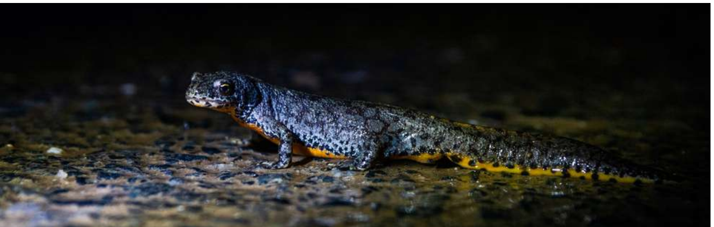
Triton alpestre