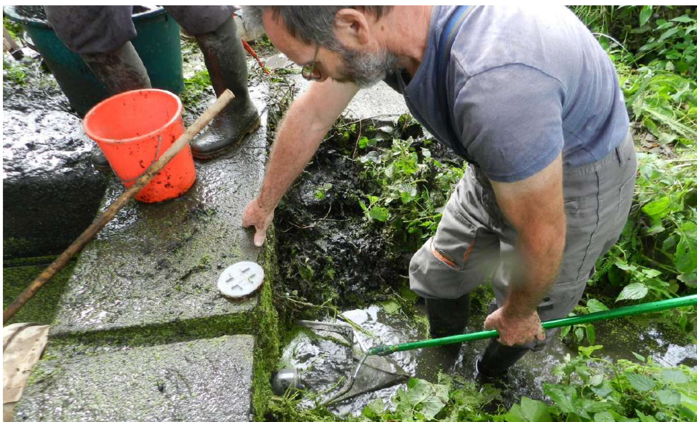
Filtration de la vidange