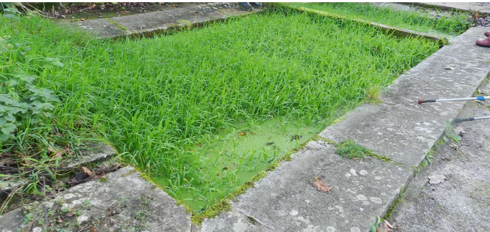
Agrostis stolonifère colonisant un bassin en novembre

Parmi les végétaux aquatiques il peut apparaître pendant l'été quelques feuilles disséminées de l' Agrostis stolonifère qui peut à son tour se densifier et supplanter partiellement les callitriches.