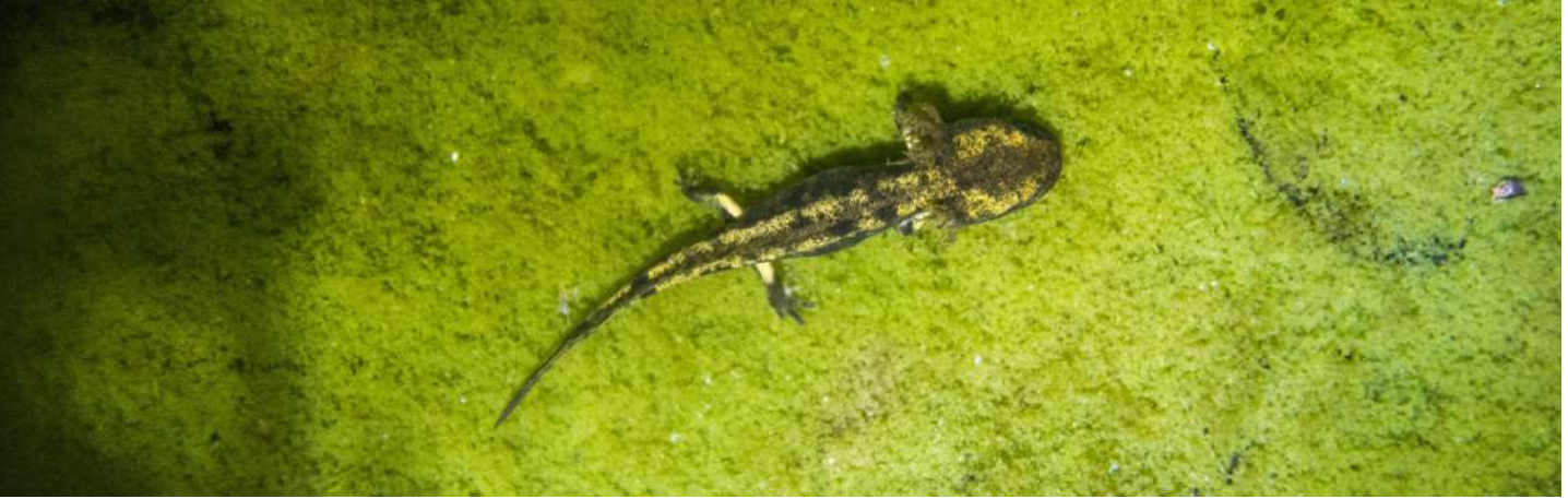
Larve de Salamandre tachetée

Les amphibiens les plus fréquents dans les lavoirs sont le Triton palmé et la Salamandre tachetée . Seule la femelle de cette dernière approche brièvement les lavoirs pour mettre bas ses larves, mais elle n'y séjourne pas. Moins fréquemment, il est également possible d'observer le Triton alpestre , le Crapaud épineux , la Grenouille agile , le Triton marbré , l' Alyte accoucheur et la Grenouille rousse .