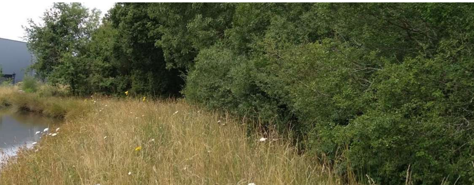
Ourlet d'arbustes se développant entre prairie et boisement, à conserver pour la biodiversité

Une hauteur de coupe minimale de 10 cm permet d'épargner les espèces se déplaçant au sol. Il faut laisser la coupe sur place 2 à 10 jours afin de permettre à la petite faune de s'en échapper. On effectue un ramassage doux sans aspiration. Le ramassage à la fourche à foin est idéal.