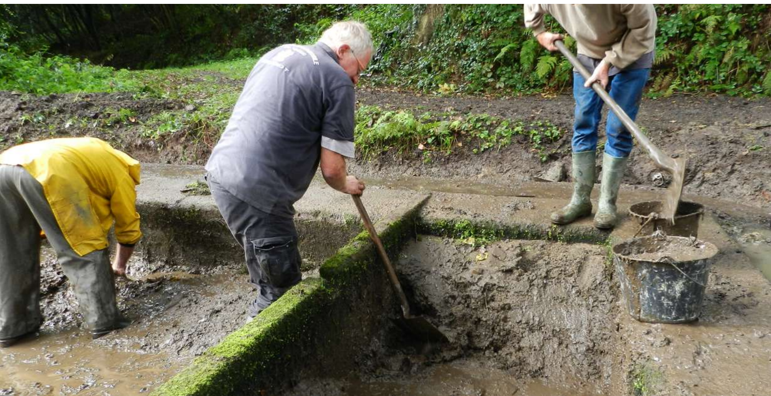
Curage de la boue de ravinement © Lavoires et fontaines à Plaintel

Enfin, ces sédiments organiques ne doivent pas former une couche épaisse dégageant une odeur désagréable quand elle est remuée, indice d'absence d'oxygène, due à une accumulation trop importante de matières organiques. Cette situation exceptionnelle peut justifier un curage du lavoir. Elle se manifeste en particulier dans le cas d'un débit de source insuffisant pour oxygéner le lavoir, ralentissant ainsi la minéralisation.