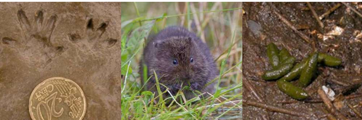
Campagnol amphibie et ses indices de présence

On peut y découvrir le Campagnol amphibie , espèce protégée, répartie uniquement dans l'ouest de l'Europe et plus abondante dans l'ouest de la Bretagne. Cette espèce très discrète laisse des indices que vous pouvez rechercher aux abords des lavoirs : empreintes, fèces et traces de repas.