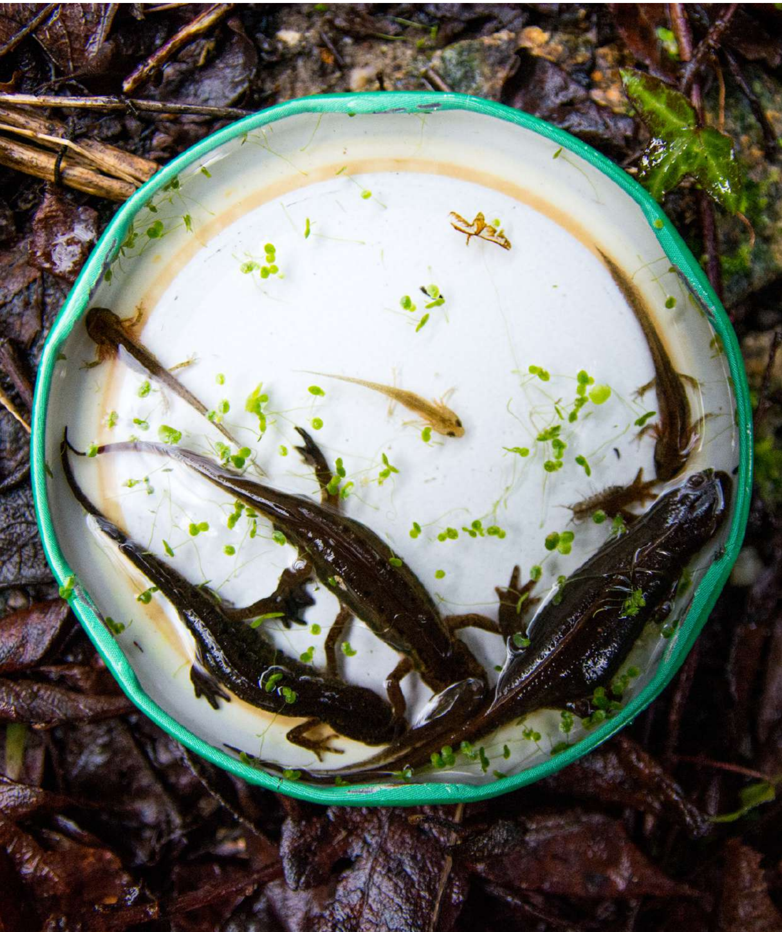
Tritons palmés (un mâle reconnaissable à ses palmures noires, deux femelles, petites et grandes larves)