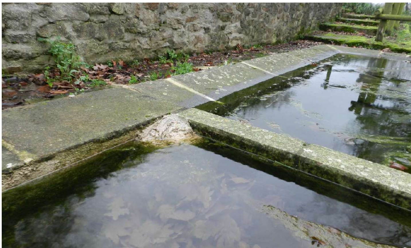
Rampe conique maçonnée facilitant la sortie de la faune