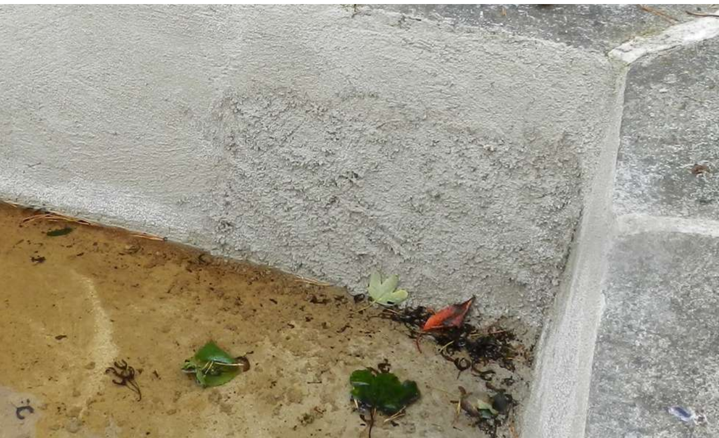
Pente douce et enduit gratté facilitant la sortie de la faune