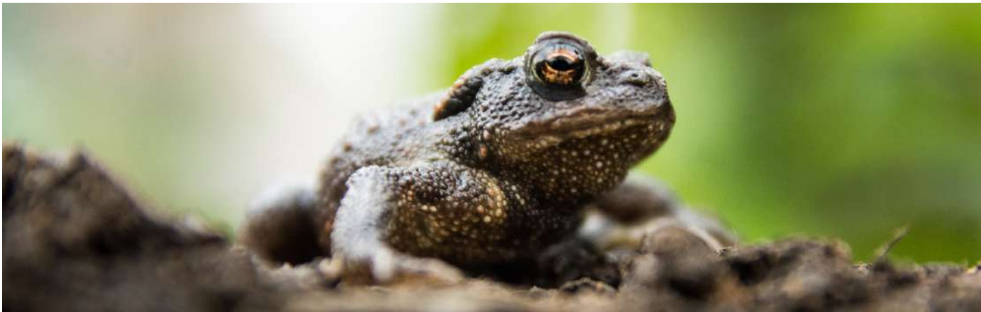
Crapaud épineux