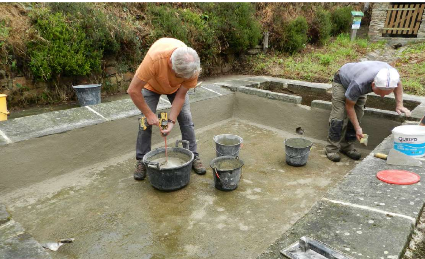
Recours à un mortier sable - ciment à l'intérieur du lavoir