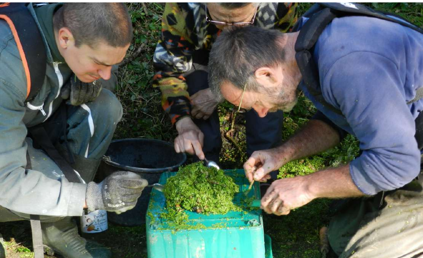
Tri de la végétation flottante © Lavoires et fontaines à Plaintel