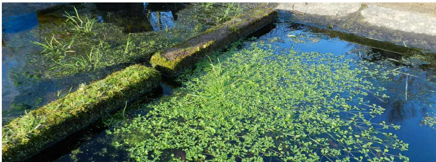
Extension en surface de la callitriche au mois de janvier

À la surface, il est possible d'observer des callitriches qui se multiplient par graine et dont les plantules apparaissent en hiver au fond des bassins. Leurs feuilles, assez petites, se distinguent de celles des lentilles d'eau par leur plus grande taille et parce qu'elles sont disposées en rosettes et reliées par de fines tiges. Les callitriches forment un voile de couverture mélangé à d'autres espèces ou bien elles peuvent constituer un coussin très dense.