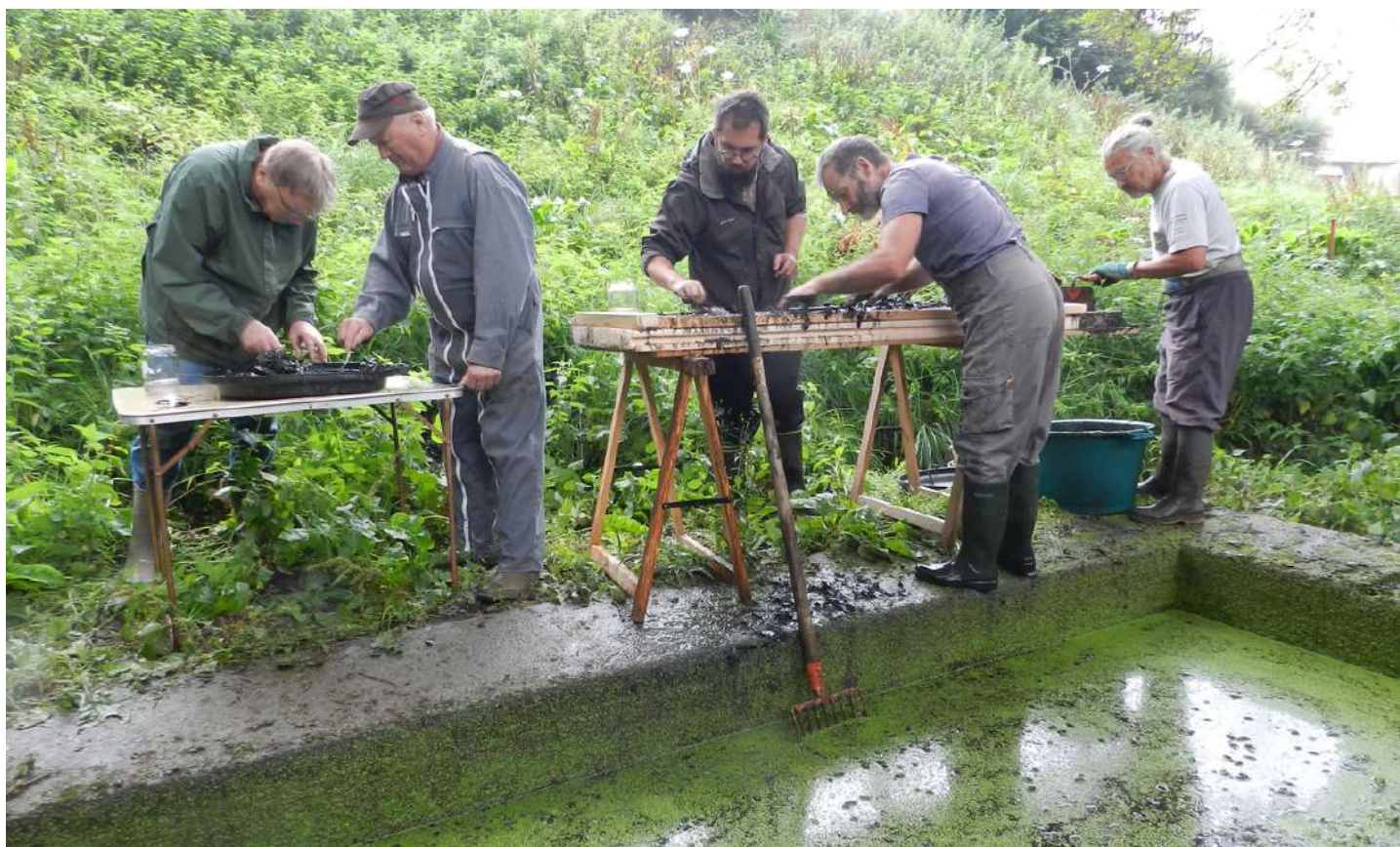
Tri des sédiments © Lavoires et fontaines à Plaintel