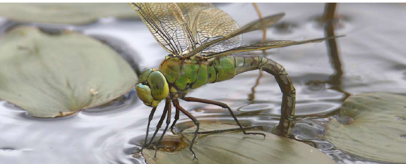
Anax empereur

D'autres espèces venant d'un ruisseau proche explorent parfois les lavoirs comme le Caloptéryx vierge , bleu métallisé chez le mâle, et le Cordulégate annelé , noir et jaune.