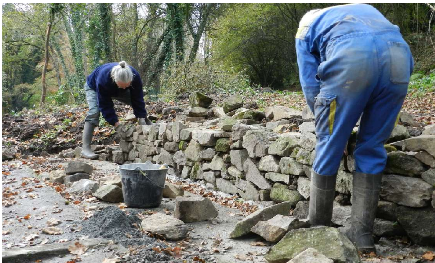
Construction d'un muret en pierre sèche