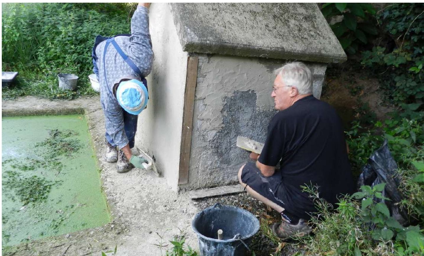
Recours à un mortier sable - chaux à l'extérieur du lavoir