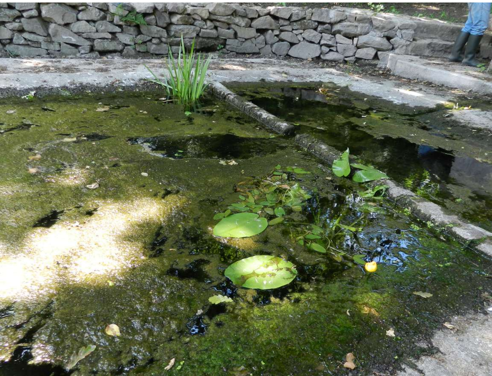
Nénuphar jaune et Rubanier dressé introduits dans le lavoir

Cette méthode est, par ailleurs, réservée aux lavoirs suffisamment profonds qui ne s'assèchent pas à l'étiage.