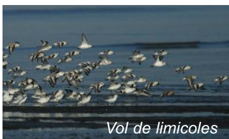
Vol de limicoles