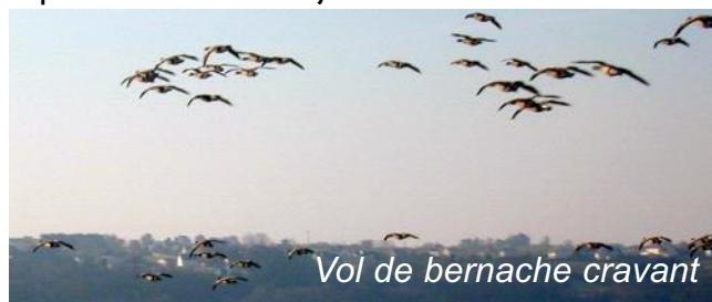
Vol de bernache cravant

Comme la migration en vol battu demande beaucoup d'énergie, les espèces qui pratiquent ce genre de vol font des pauses fréquentes. Ces espèces sont moins soumises aux vents.