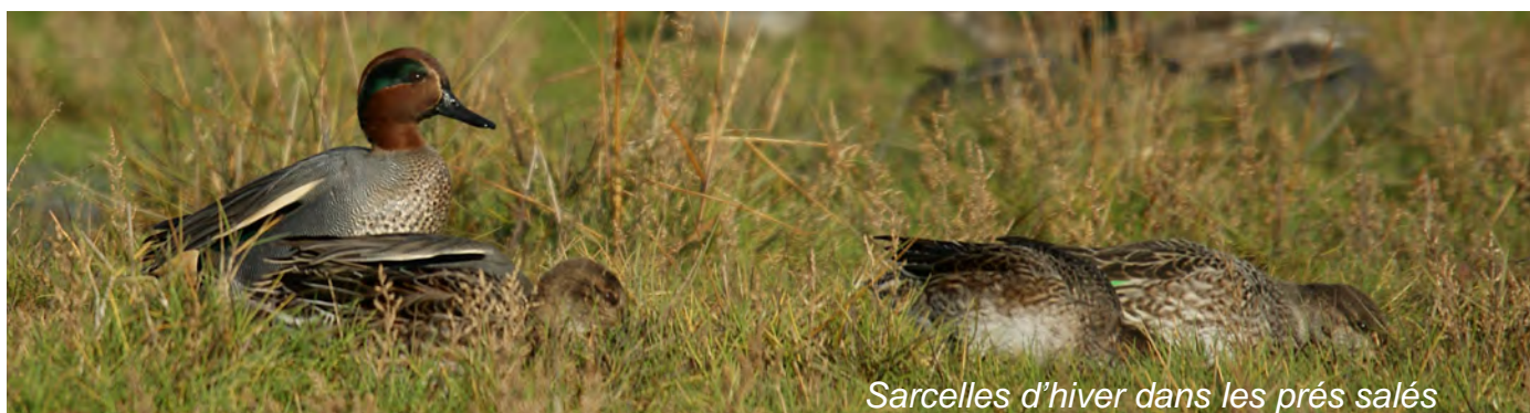
Sarcelles d'hiver dans les prés salés